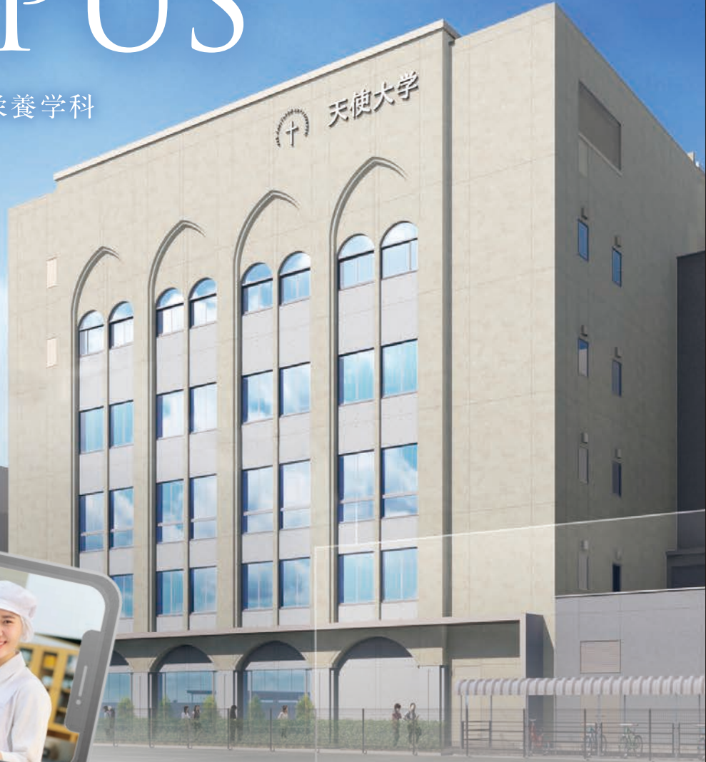
2020年に完成した新棟